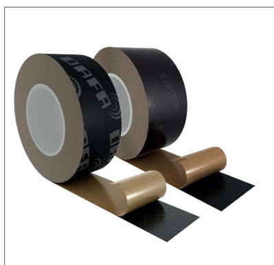
DAFA UV tapes med og uden logo.

DAFA UV tape er optaget i Nordic Ecolabellings database for byggeprodukter, som kan anvendes i Svanemærket byggeri.