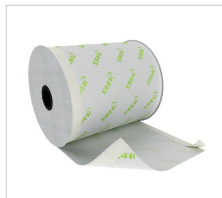
DAFA ExFoil lysningsfolie med hhv. 2 x dobbelt klæb og med dobbelt klæb og butyl.