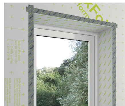
DAFA ExFoil lysningsfolie er CE-mærket efter EU-standard EN 13984.