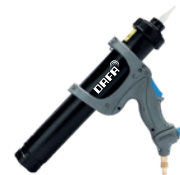
DAFA SprayBarrier™ Pistol med sprøjte- og fugefunktion i ét.