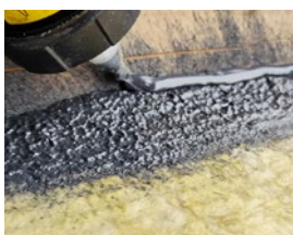
Med fugefunktionen lægges en fuge langs kanten. Sørg for at der er materiale nok til at dampspærren kan presses ned i den.