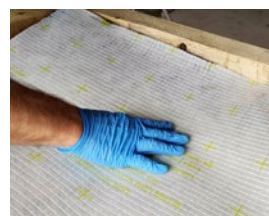
Læg den tilpassede ExFoil dampspærre ovenpå, og tryk den fast. Husk at bagsiden af dampspærren skal vende nedad.