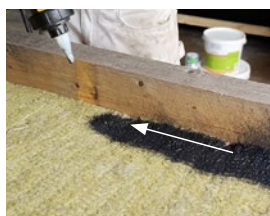
Spray et 10 cm bredt 1. lag på langs med ca. 20 - 25 cm afstand.

Læs mere om DAFA SprayBarrier på www.dafa-build.com/dk/spraybarrier