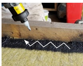
Kryds-spray lag 2. Kom helt tæt på kanten (ikke op ad kanten)