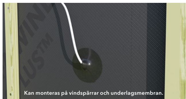
DAFA Renoveringsmanschett Ø115, Ø160, Ø250 og Ø300 mm

Kan monteras på vindspärrar och underlagsmembran.