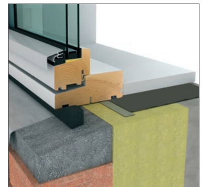
DAFA Duo Foil Auskleidungsfolie in Fensterkonstruktion