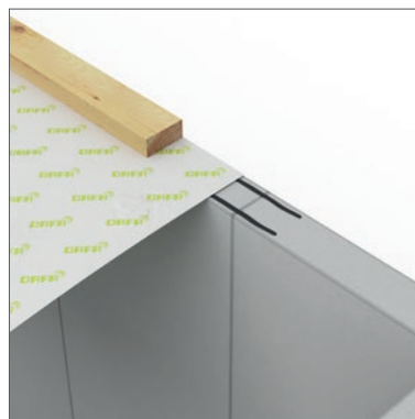
DAFA ExFoil Sockelfolie - für Außenwände