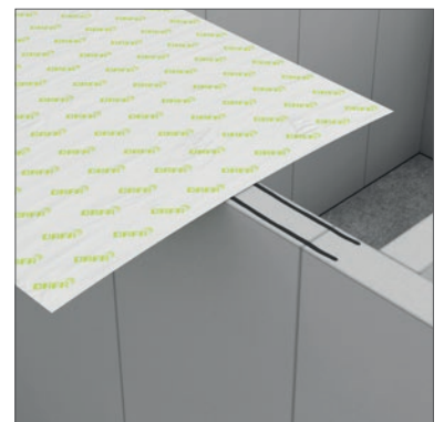
DAFA ExFoil Sockelfolie - für Innenwände