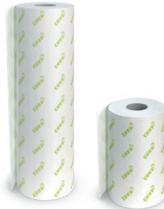
DAFA ExFoil Sockelfolie. 500 mm oder 1050 mm × 50 m