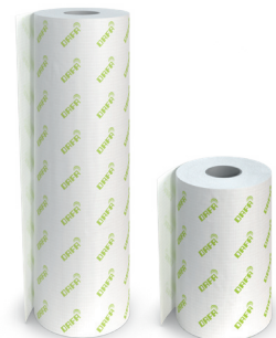
DAFA ExFoil remfolie. 500 mm eller 1050 mm x 50 m