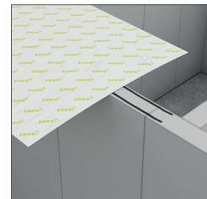
DAFA ExFoil remfolie - ved indervæg