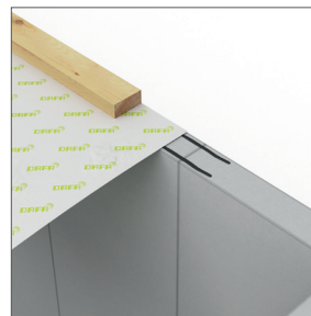
DAFA ExFoil remfolie - ved ydervæg