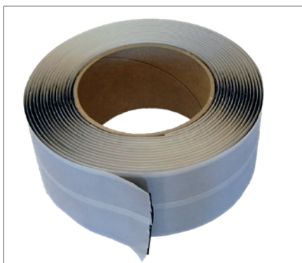
DAFA Multi Sealing

Minst 2 år från tillverkningsdatum under normala förvaringsförhållanden.