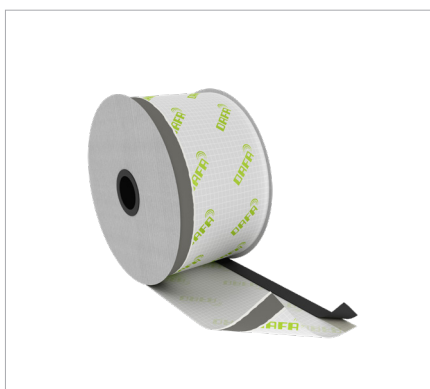
DAFA ExFoil fönster folie med 2 x dubbelhäftande tejp respektive dubbelhäftande tejp och butyl.

DAFA ExFoil-fönster folie säkerställer en ångtät lösning i konstruktionen. Många överlappningar och handskurna foliekanter ökar risken för ett dåligt slutresultat. Med DAFA ExFoil fönster folie kan du enkelt och säkert montera ångspärrar på alla fyra fog-/fönstersidor.