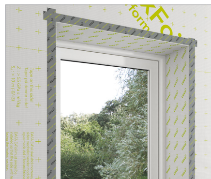
DAFA ExFoil fönster folie är CE-märkt enligt EU-standard SS-EN 13984.