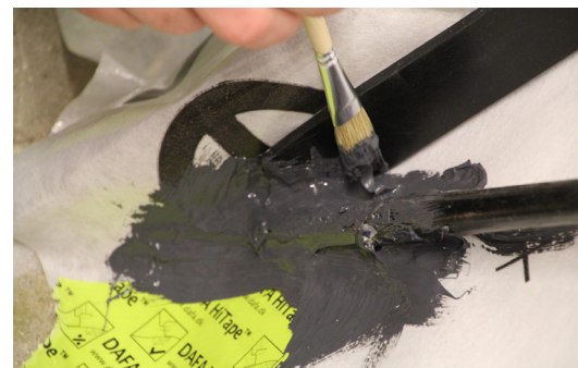
Enkel tätning av komplicerade små skarvar. Kan penslas och sprejas.