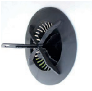
Færdigmonteret set indefra.