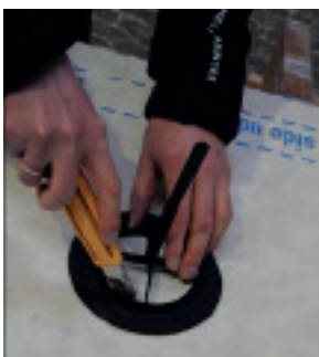
Marker og skær hul i undertaget.