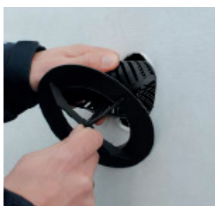
Pres undertagesventilen sammen, så undertaget er placeret mellem dækslet og underdel.