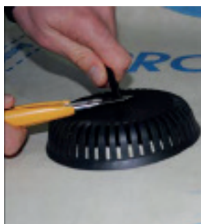
Stripsen skæres af ca. 1 cm over dækslet.