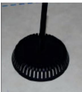
Undertagsventilen er nu monteret.