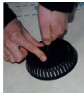
Overdelen presses ned mod undertaget.