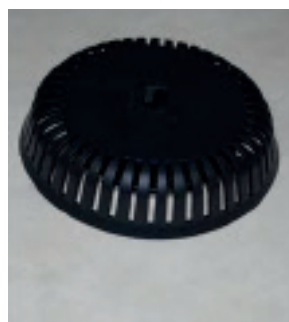
Færdigmonteret set udefra.