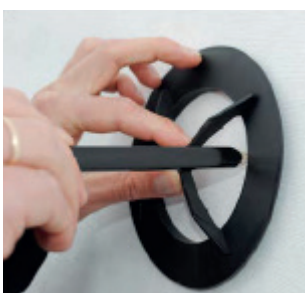
Marker og skær hul i undertaget.