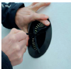
Dækslet trækkes tramt ned til undertaget indefra.