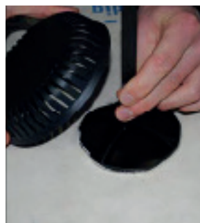
Hold fast i stripsen og monter overdelen.