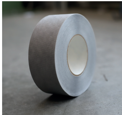
DAFA sparkel and puss tape

Det unike klebestoffet av en akrylblanding, opprettholder god ytelse når det blir utsatt for fukt og damp, og øker dermed den forventede levetiden for tetningen, spesielt på byggematerialer som utsettes for utvidelse og sammentrekninger.