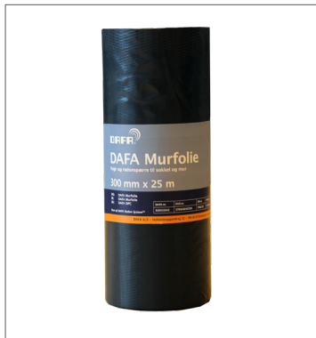
DAFA murfolie, 300 mm x 25 mm

DAFA murfolie er registrert i databasen for byggeprodukter som kan brukes i svanemerkede bygg.