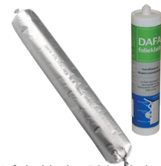
DAFA folieklæb i 580 ml alu foliepose og 310 ml tube.