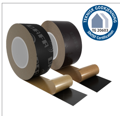
DAFA UV tape.