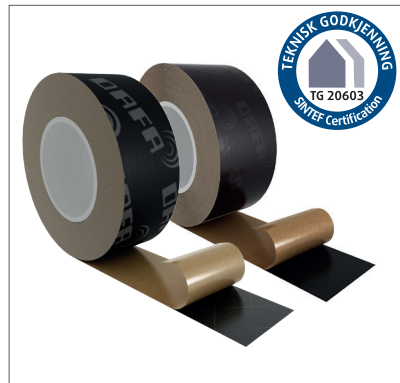
DAFA UV tape.

Last ned EPD på DAFA UV tape her: www.dafa-build.com/dk/epd eller scan QR koden