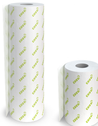
DAFA ExFoil kantfolie. 500 mm eller 1050 mm x 50 m