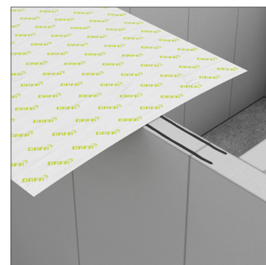
DAFA ExFoil kantfolie - vid innervägg