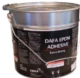
DAFA EPDM High Tack-lim 5-liters bøtte.