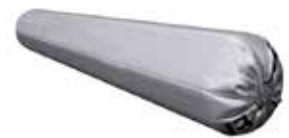
DAFA EPDM High Tack-lim til fugepistol.