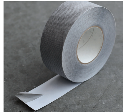
En tejp med delad baksida