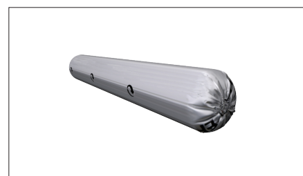
Butyl 200, påse 600 ml.