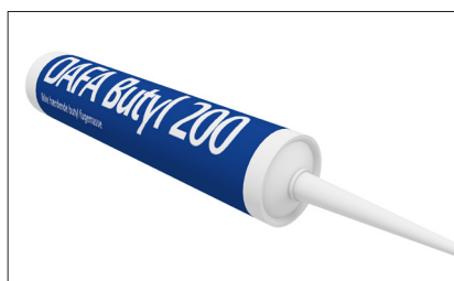
Butyl 200, tub 310 ml.